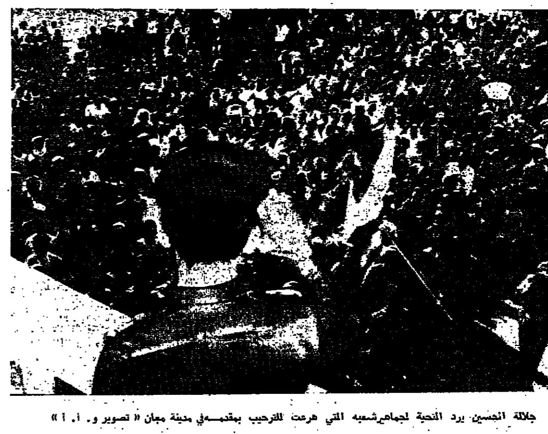
جلالة الحسين يرد التحية لجمهور شعبه التي هزعت للترحيب بقدومه في مدينة عمان « تصوير ١.١ »

عمان - و. أ. ١ - واصل جلالة الملك الحسين المعظم لقاءاته مع أفراد أسرته الأردنية الوفية ، للاطلاع على أحوالهم ، وتفقد شؤونهم . فقد قام جلالة أمسي بجولة تفقدية واسعة شملت مناطق الجنوب حيث زار مناطق وادي موسى والشوبك ، والحضر ، ومعمان ، والعبقة ، واجتمع هناك بالمواطنين من سكان تلك المناطق وبنى العشاير الأردنية ، واقتنع عددا من الشروعات الإنمائية التي سيستفيد منها عدد كبير من السكان وبنى العشاير . وقد صاحب جلالاته في هذه الجولة سمو الأمير حسن ولي العهد المعظم ودولة السيد بهجت التلهوني رئيس الوزراء وعدد من كبار المسؤولين في وادي موسى . قبل ظهر أمس وصل جلالة الحسين وصحبه في طائرة هيلكوبتر إلى بلدة وادي موسى بينما جالته في المناطق الجنوبية من الأردن . وكان في استقبال جلالاته السيد شاهر الحسين محافظ عمان ومدير شرطة المحافظة ومئات من فرسان البلدة الذين اقتفوا جلالاته حتى مبنى بلدية وادي موسى . وأمام مبنى البلدية جرى لجلالة الحسين استقبال رسمي وشعبي حافل ، اشترك فيه السيد يوسف العضايلة مدير ناحية وادي موسى ، ورئيس واعضاء المجلس البلدي ، وشيوخ عشاير وادي موسى ، وجهاء غيرة من سكان البلدة والقرى الجاورة . البقية على صفحة ٥ ع ٥